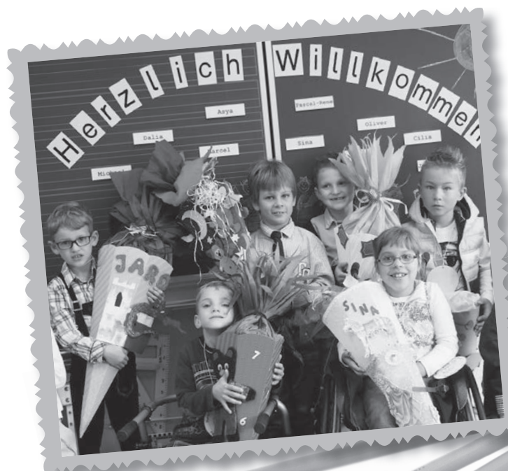
Unsere stolzen Erstklässler

Mädchen lernten ihre Lehrer und Betreuer kennen; sie werden zukünftig in drei Klassen unterrichtet. In den Klassenzimmern durften die Kinder ihre Schultüten öffnen und von den Leckereien naschen. ■