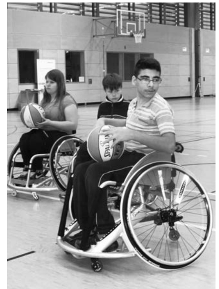
Dank Pool-Billard zum Sportrolli

Originell war auch die Aktion des 1. Königsbrunner Pool Billard Clubs anlässlich seines 25-jährigen Jubiläums. Vier Spieler lieferten sich einen 50 Stunden-Marathon am Spieltisch.