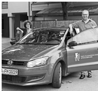
Bessere Klientenbegleitung dank der Fahrzeugspende

Neben all den finanziellen Zuwendungen freuen wir uns diesmal insbesondere über eine Sachspende, die die tägliche Arbeit unseres Beratungsteams erleichtert. Die Ruth-und-Hermann-