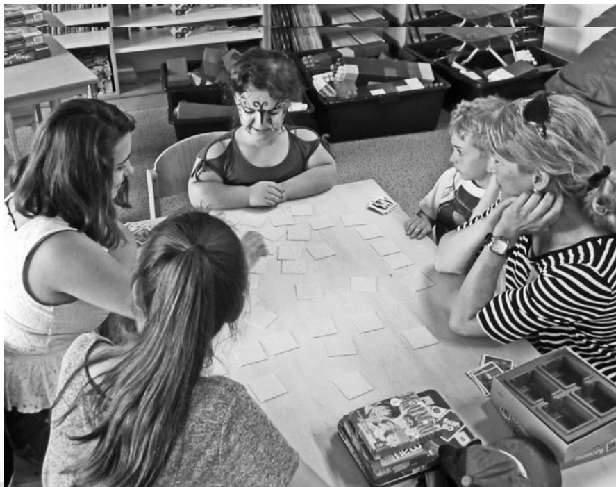
Schüler des FFH und des Rudolf-Diesel-Gymnasiums beim gemeinsamen Memory-Spiel