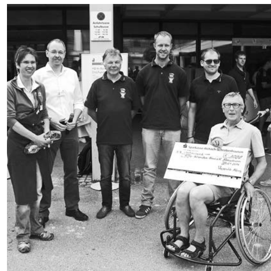
Sportrolli für begeisterte Basketballer mitfinanziert vom Weizenclub Affing

Zahlreiche Harley-Freunde des Around the World Chapter e.V. nutzten unser jährliches Sommerfest für einen beeindruckenden Auftritt und übergaben uns eine Spende in Höhe von 3.333,- €. Das Geld stammt aus einer Charity-Aktion des Vereins: Für jeden gefahrenen Kilometer spenden die Mitglieder einen Cent. Auch der Weizenclub Affing zeigte seine Verbundenheit mit unserem Haus und steuerte 1000,- € bei.